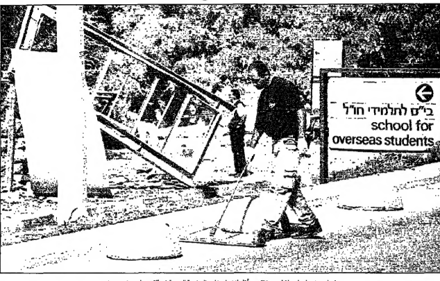
خيار متبصرات اسرائيليين يتفقدون اثر الاندماج خارج الجامعة العربية في القدس

القدس - الامم المتحدة: منحت اسرائيل ايامها الاخيرة في القدس المحتلة، حيث أعلنت انها لن ترحب بعودة الفلسطينيين الى المدينة المقدسة. وقالت الخارجية الامريكية ان اسرائيل لن ترحب بعودة الفلسطينيين الى القدس المحتلة، حيث أعلنت انها لن ترحب بعودة الفلسطينيين الى المدينة المقدسة. وقالت الخارجية الامريكية ان اسرائيل لن ترحب بعودة الفلسطينيين الى القدس المحتلة.